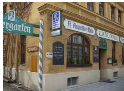
Westend- und Schwanthalerstrasse: Sardisches Restaurant, Royal India, Zur Schwalbe