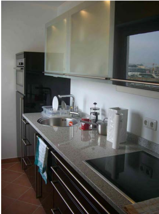
LANDSBERGER STRASSE 74